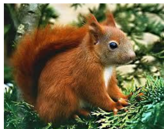
Wiewiórka: tatrzańska i ruda.