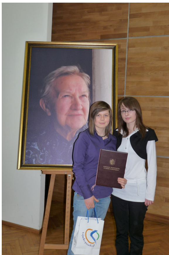
Agata i Dominika przy portrecie gen. Elżbiety Zawackiej

Prezentacja multimedialna „Kazimierz Szłowski 1890-1939, wiceburmistrz Łasina” przygotowana przez uczennice klasy 3a została wyróżniona w tym konkursie. Na uwagę zasługuje fakt, że była to jedyna praca wyróżniona spośród rejonu grudziądzkiego. Gratulacje!!!