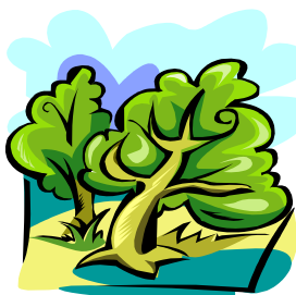
Piękna przyroda zaprasza nas, by z niej korzystać :-)

Jeśli Wam zabraknie pomysłów na pozdrowienia wakacyjne, skorzystajcie z tych: