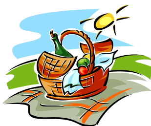
Koszyk z jedzonkiem, kocyk

Moje pomysły już wyczerpane – ciekawe, z czego skorzystacie, a może jeszcze inaczej spędzicie te dni.