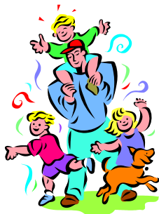
Pamiętajcie również o Dniu Ojca!

opieką, osobą, na której zawsze można polegać, z domem rodzinnym.