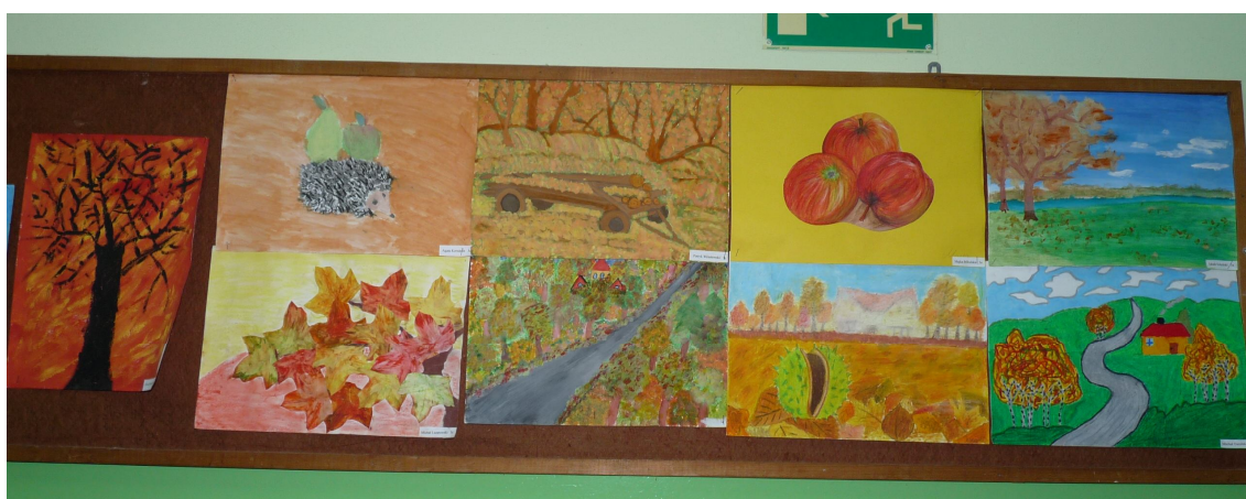
Jesienne prace naszych kolegów – hol II piętra