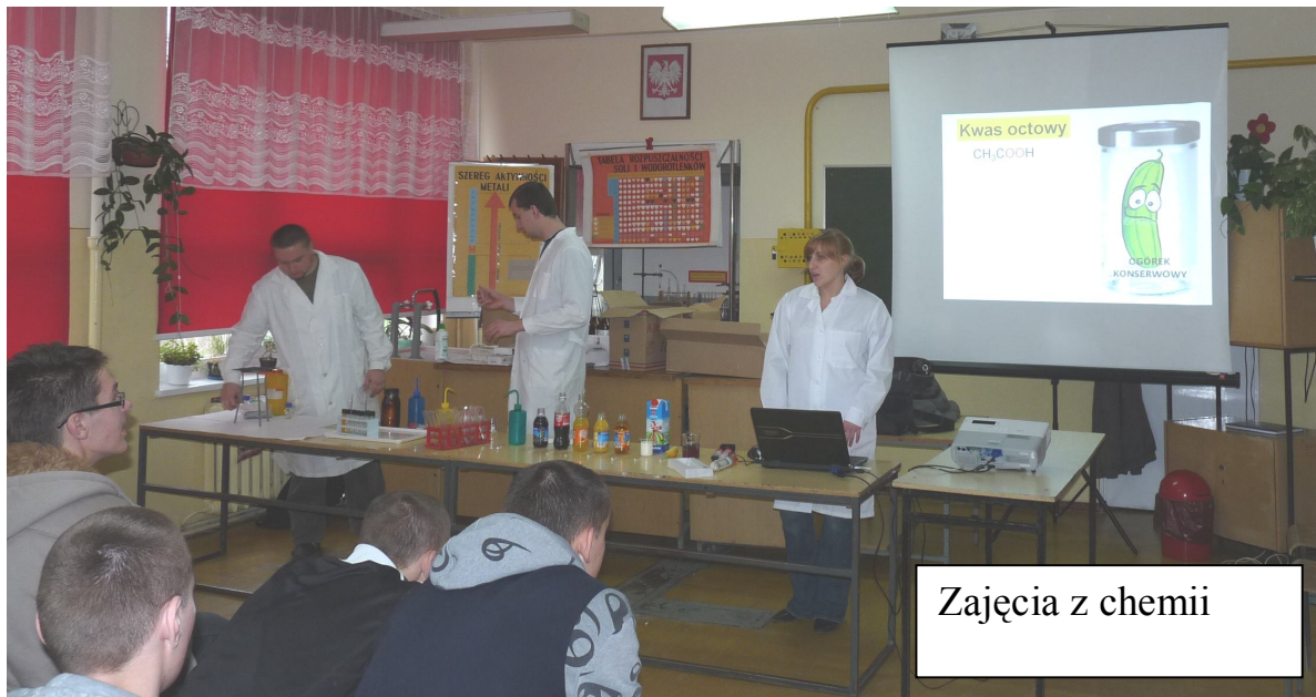
Zajęcia z chemii