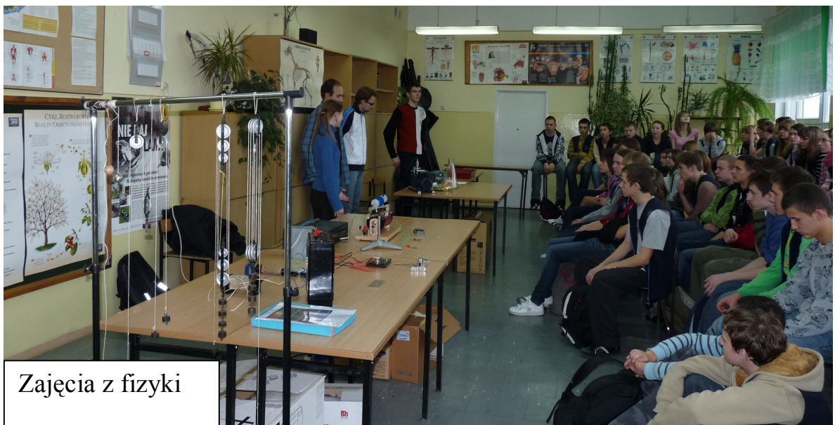
Zajęcia z fizyki