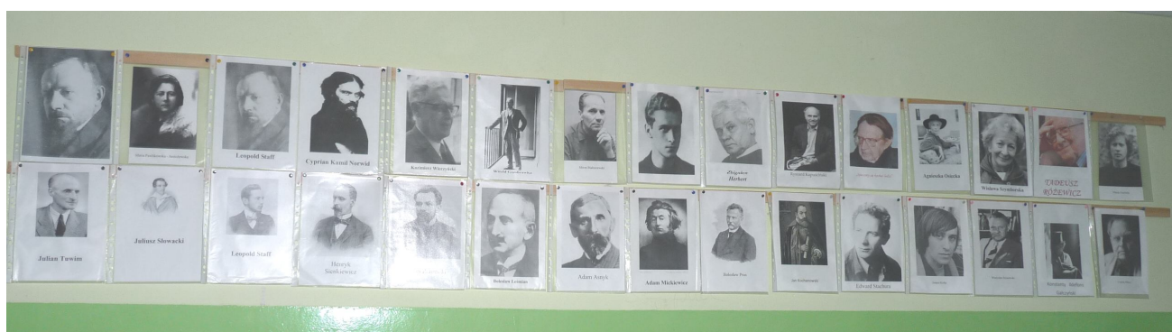
Wystawa na holu II piętra