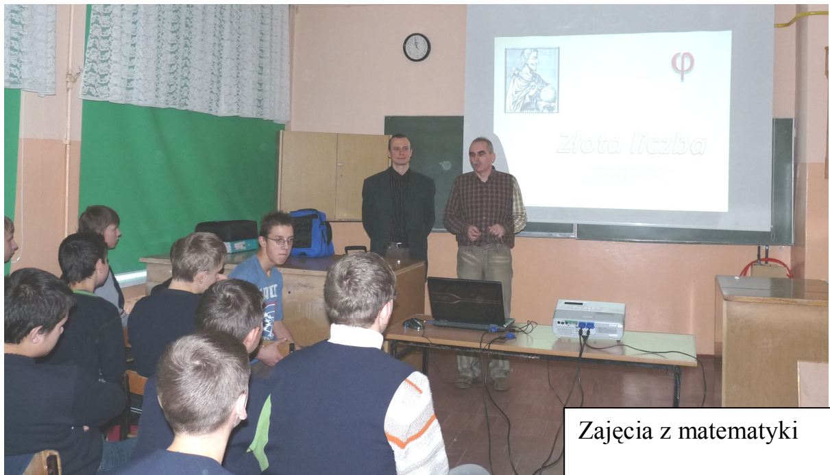
Zajęcia z matematyki