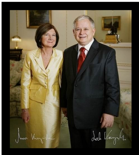
Lech Kaczyński i Maria Kaczyńska

Dnia 10 kwietnia 2010 r. zginęła elita polskiej polityki i wojska, życia społecznego: